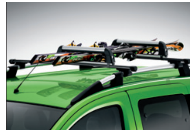
PORTASCI PER 3 SCI

Vincolato a 71803195 e vincolato alle barre trasversali 50902133.