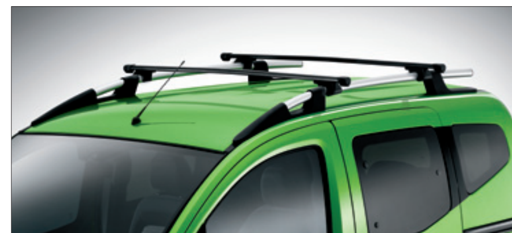
KIT 2 BARRE TRASVERSALI SU LONGITUDINALI