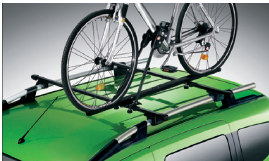
PORTABICI SU BARRE

Vincolato alle barre trasversali 50902133.